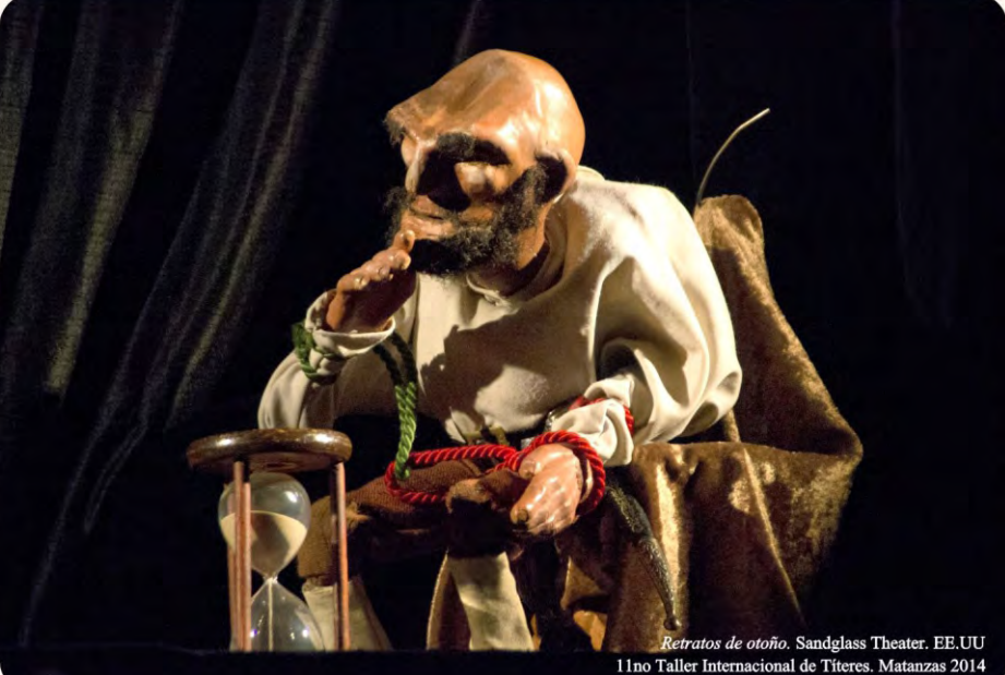
Retratos de otoño. Sandglass Theater. EE.UU 11no Taller Internacional de Títeres. Matanzas 2014