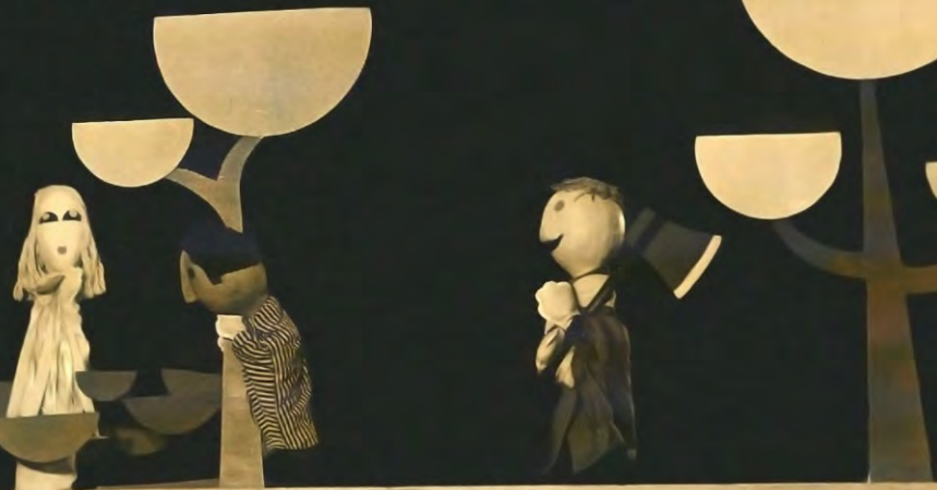
Los dos leñadores. Guiñol de Matanzas 1965.

Pedro Alfonso (Matanzas, 1934 - 2012) músico y fotógrafo. Miembro de la UNEAC. Considerado el primer fotógrafo que de forma profesional desde el Departamento de Divulgación y Propaganda de la Coordinación Provincial de Cultura retrata el teatro de títeres en Matanzas.