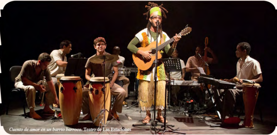
Cuento de amor en un barrio barroco. Teatro de Las Estaciones