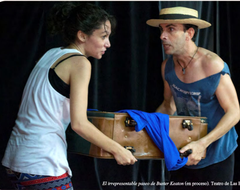
El irrepresentable paseo de Buster Keaton (en proceso). Teatro de Las Estaciones