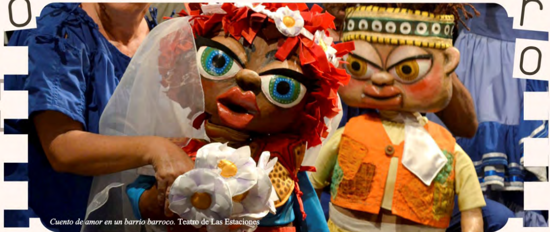
Cuento de amor en un barrio barroco. Teatro de Las Estaciones