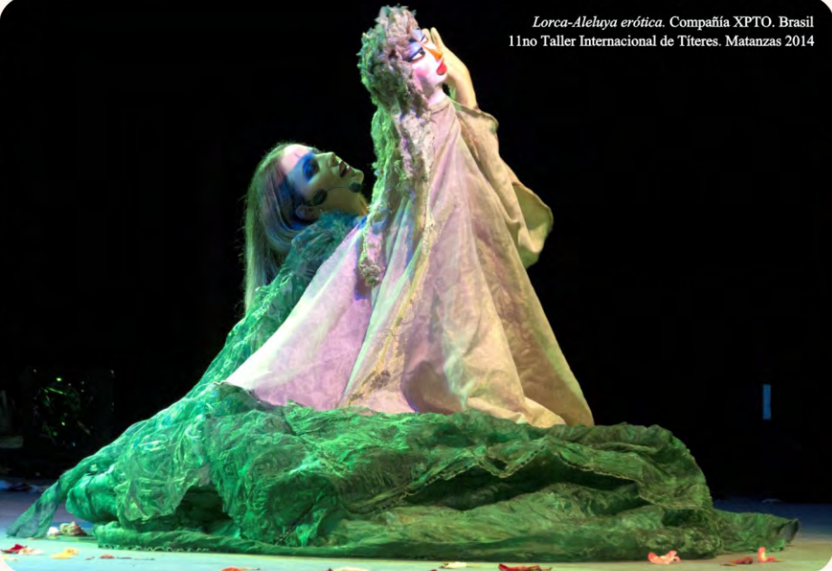
Lorca-Alehuja erótica. Compañía XPTO. Brasil 11no Taller Internacional de Títeres. Matanzas 2014