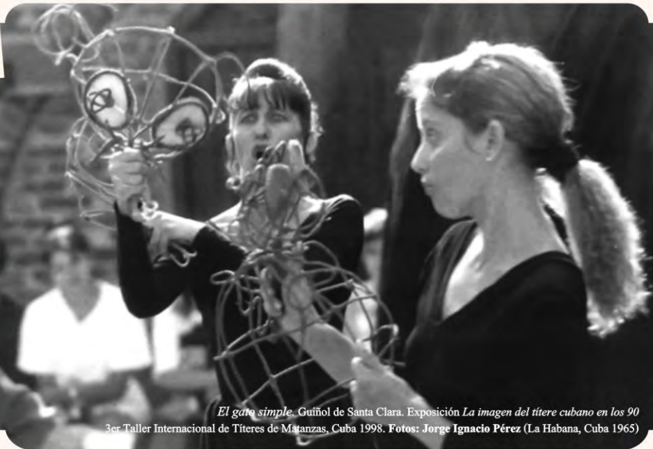
El gato simple. Guñol de Santa Clara. Exposición La imagen del títere cubano en los 90 3er Taller Internacional de Títeres de Matanzas, Cuba 1998.