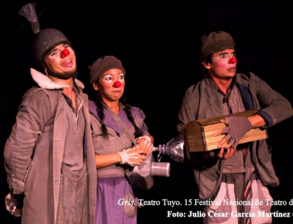
Gris . Teatro Tuyo. 15 Festival Nacional de Teatro de Camagüey, Cuba 2014