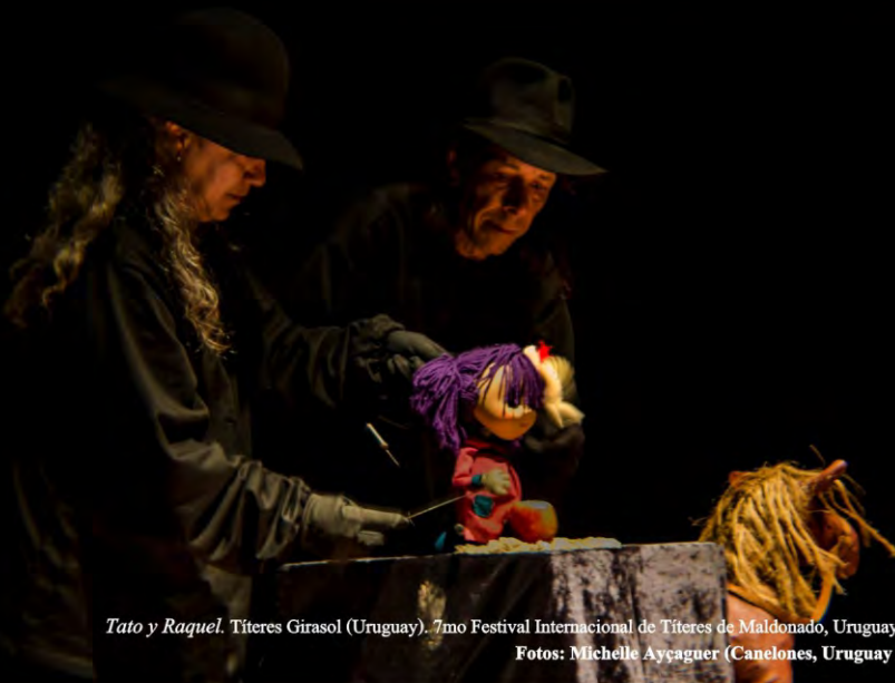
Tato y Raquel. Títeres Girasol (Uruguay). 7mo Festival Internacional de Títeres de Maldonado, Uruguay 2014