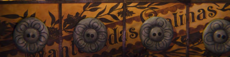
Los Títeres de Cachiporra. Teatro SEA (EE.UU). 7mo Festival Internacional de Títeres de Maldonado, Uruguay 2014