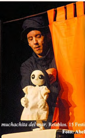
La muchachita del mar . Retablos. 15 Festival Nacional de Teatro de Camagüey, Cuba 2014